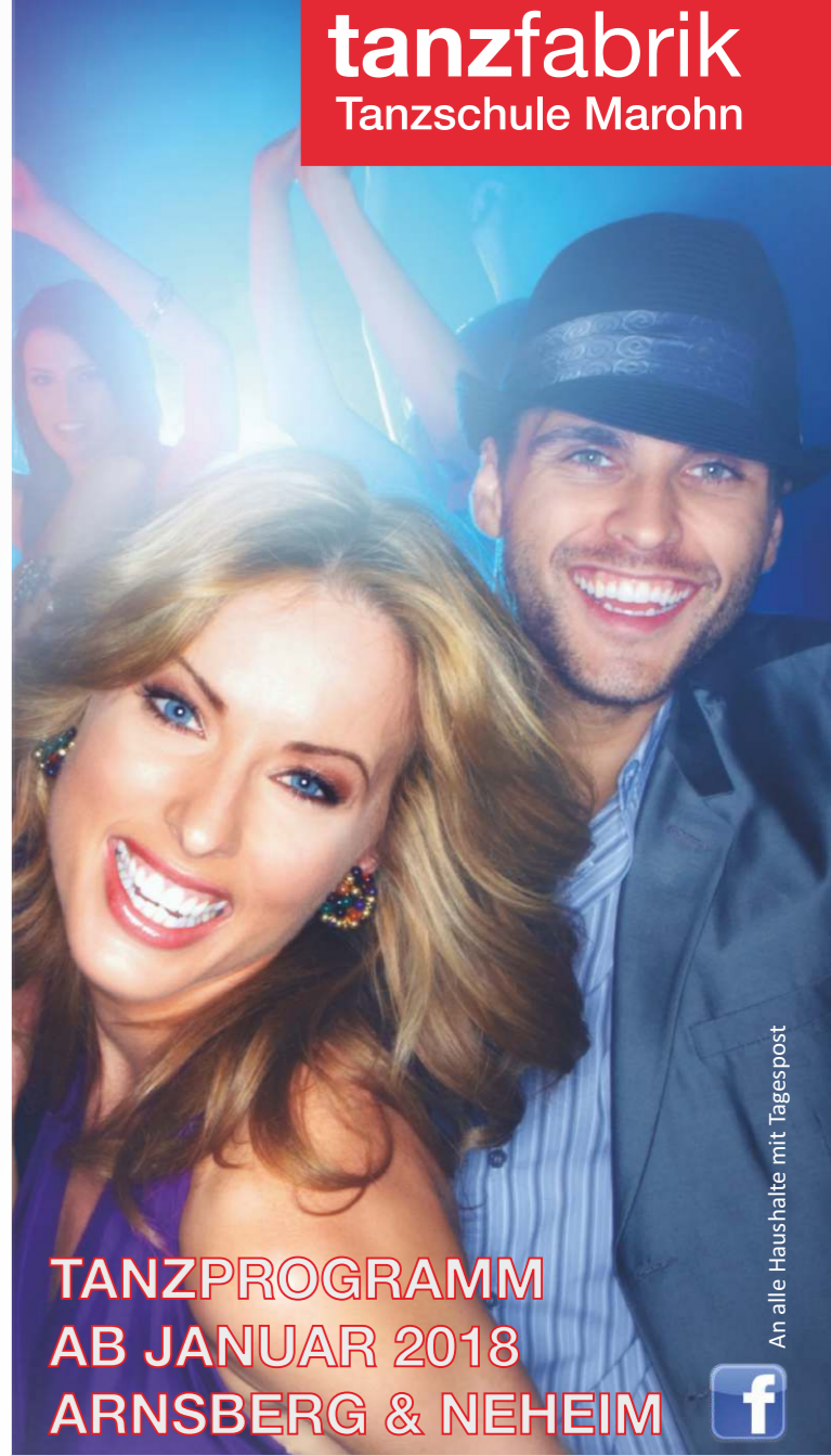
An alle Haushalte mit Tagespost